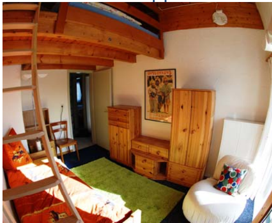
Galerie Zimmer mit Einzelbett